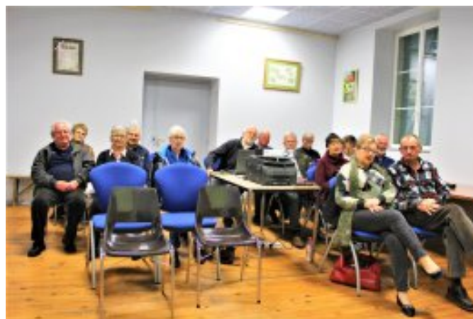
Conférence à Baladou du 11 novembre 2019