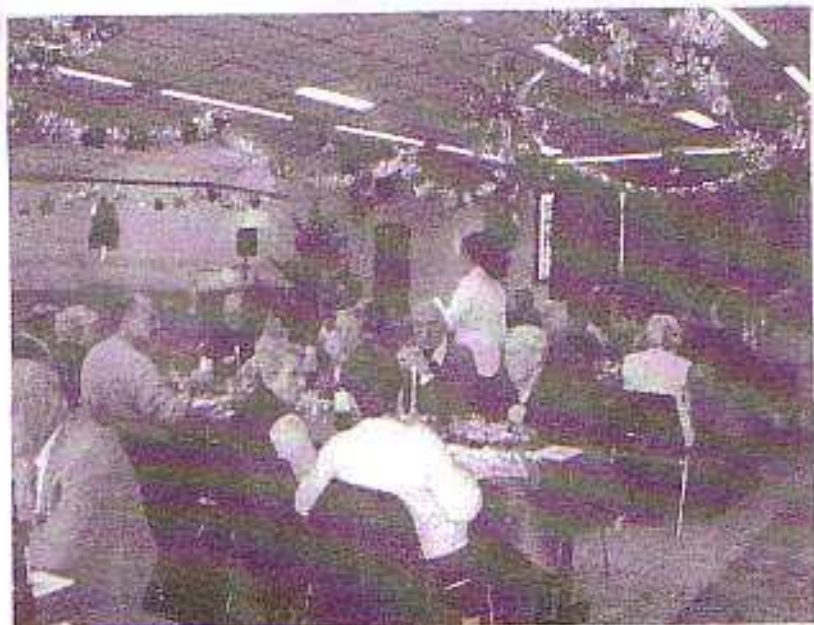
Le repas de fin d'année