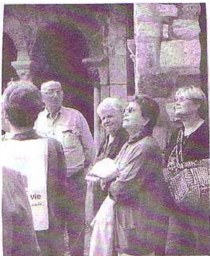
Voyage surprise à ALBI & CORDES